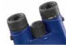
TERRA® ED 8×42 von ZEISS

Die intensivsten Erlebnisse stecken oft in den kleinsten Details. Das neue TERRA® ED 42 von ZEISS bringt diese Momente zum Vorschein – in hoher optischer Qualität und mit extremem Detailreichtum. Die größere Austrittspupille garantiert eine unkomplizierte Handhabung und beste Sicht selbst bei schwierigen Lichtverhältnissen. Eben ein echter Allrounder und der ideale Begleiter für alle, die keine Kompromisse eingehen.