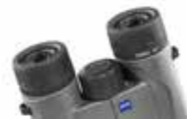
TERRA® ED 8×32 von ZEISS

Die besonderen Momente warten meist dort, wo man sie nicht erwartet. In diesen Augenblicken garantiert das TERRA® ED 32 von ZEISS gestochen scharfe Bilder – dank präzisiertem Fokus-Mechanismus auch, wenn die Motive schnell wechseln. Mit seiner kompakten Größe und gerade mal 510g liegt es gut in der Hand und ist der perfekte Begleiter für das große Abenteuer Natur.